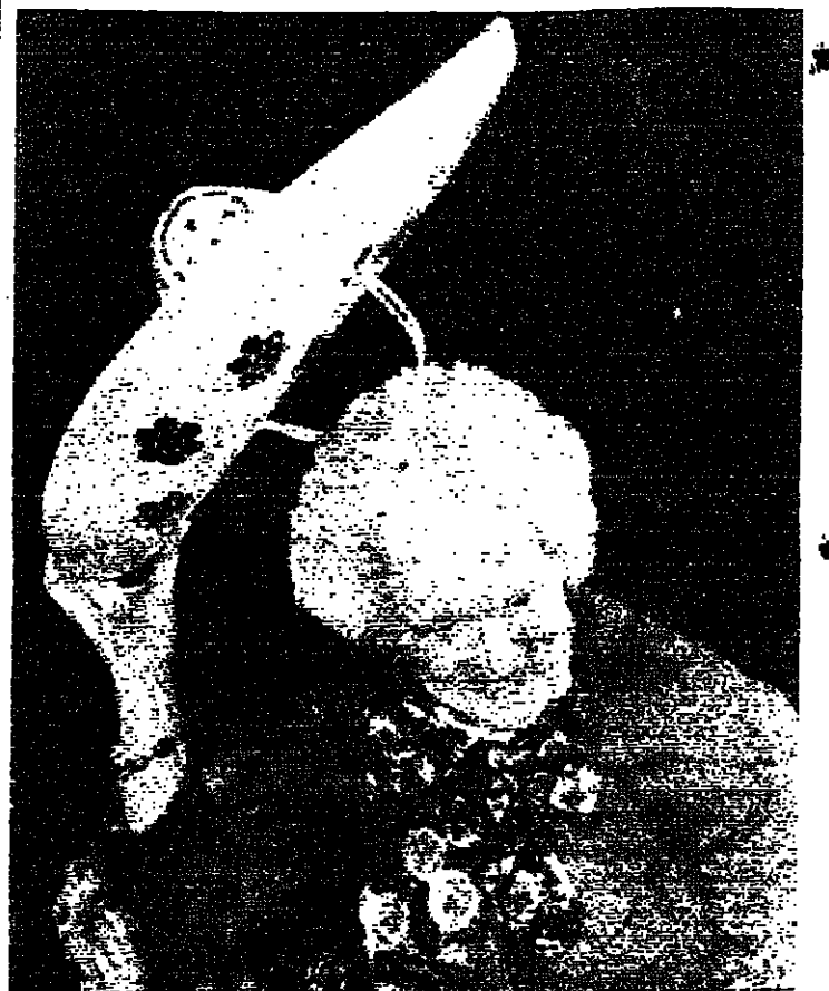
الأميركية الأولى باربرا بوش ترفع قبعة «سومبريرو» كبيرة كانت قدمنها لها حينئذها نوبل خلال احتفال أقيم في واشنطن تحت اسم «خيمة لباربرا بوش» - واشنطن - ١ ف ب